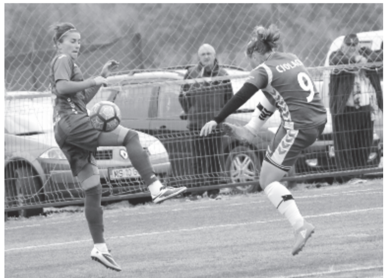
Egyre nehezebb az ASA női csapatának a helyzete – már nem csak a Kolozsvárral szemben képtelenek állni a sarat.

Folytatás jövő vasárnap a Bukaresti Fair Play ellen, ha még lesz ki, és lesz miből, ugyanis néhány mérkőzés óta Székely Károly vezetőedző saját zsebből állja a költségeket. És egy adalék azok számára, akik azzal az érvel próbálják szétverni a marosvásárhelyi sportot, hogy a helyiekre kell a pénzt költeni: a 14 fős keretből 11-en születtek Maros megyében.